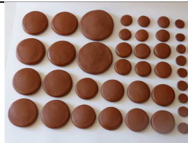
kit 39 pierres d'argile

https://www.ludion-massage.com/petite-etuve-p-66.html